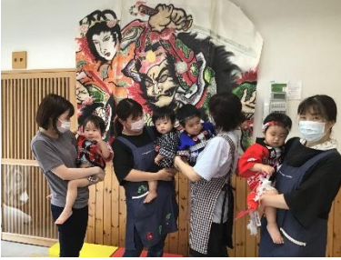
《8月5日 ねぷたごっこ》